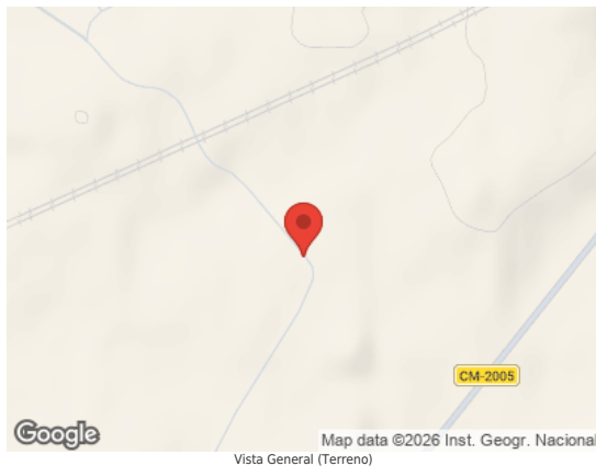
Map data ©2026 Inst. Geogr. Nacional Vista General (Terreno)