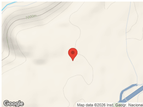
Map data ©2026 Inst. Geogr. Nacional Vista General (Terreno)