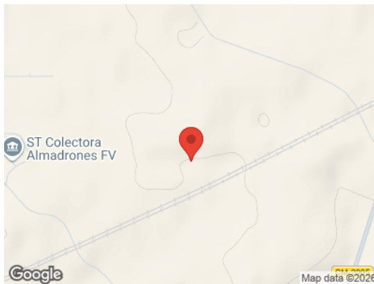
Vista General (Terreno)