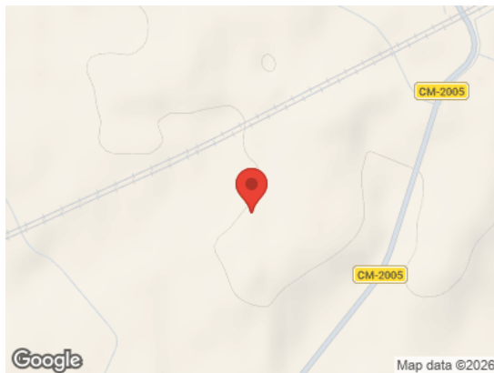
Vista General (Terreno)