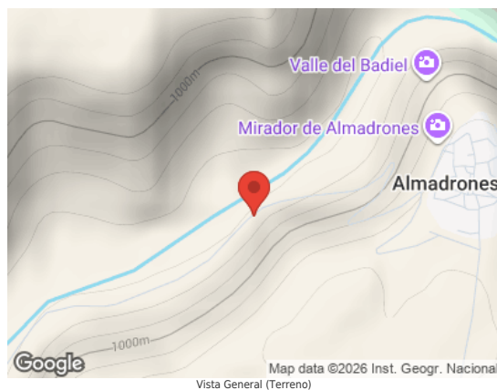
Vista General (Terreno)