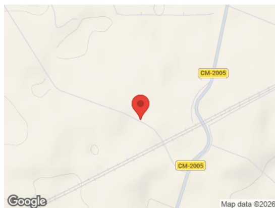
Vista General (Terreno)