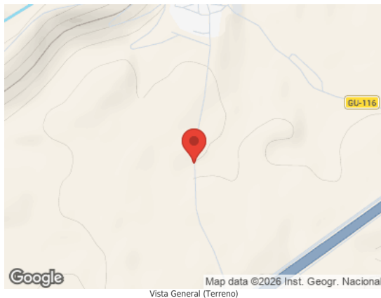
Map data ©2026 Inst. Geogr. Nacional Vista General (Terreno)