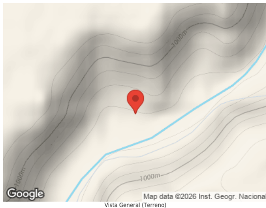
Map data ©2026 Inst. Geogr. Nacional Vista General (Terreno)