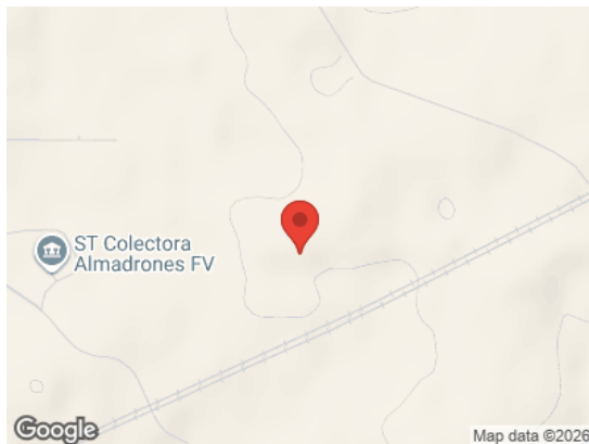
Vista General (Terreno)