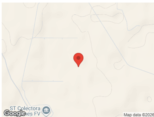
Vista General (Terreno)