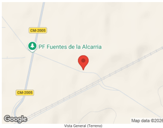
Vista General (Terreno)