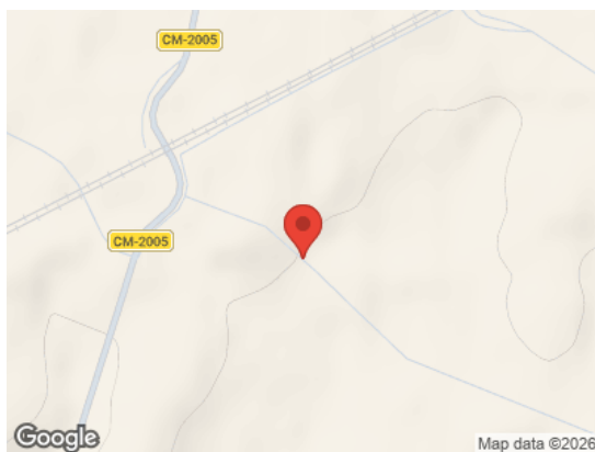
Vista General (Terreno)