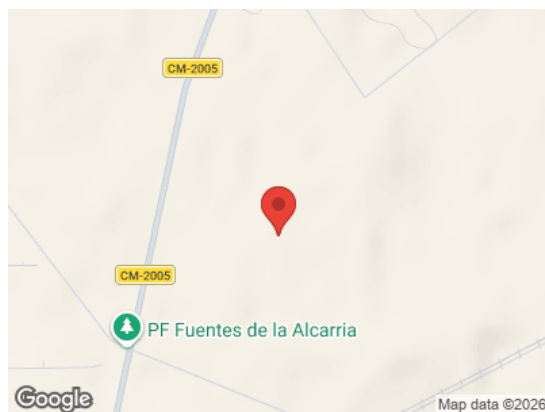
Vista General (Terreno)