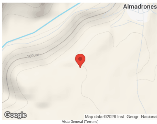
Map data ©2026 Inst. Geogr. Nacional Vista General (Terreno)