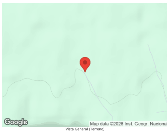
Vista General (Terreno)