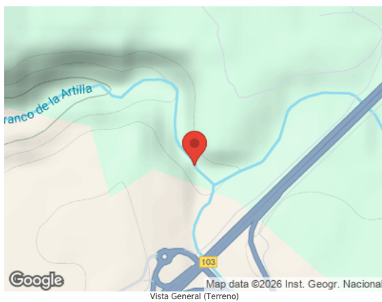
Vista General (Terreno)