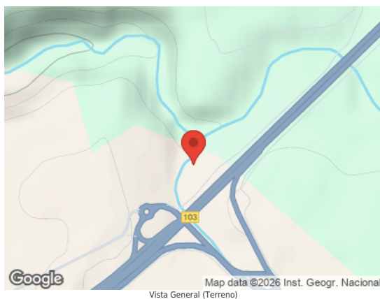
Vista General (Terreno)